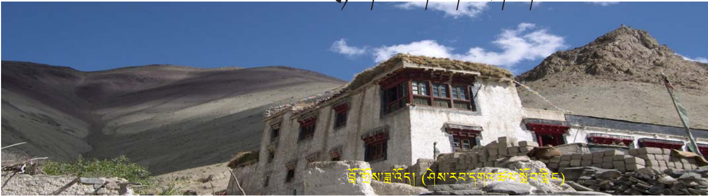
ལྷོ་ལྷོ་ས་ལྷོ་འོད། (ཤེས་རབ་དགའ་ཚལ་སྟོན་ལྷོ་ངོང་)

འཛོལ་མོ་ཞིག་ཕྱི་མིག་ལྟ་བུ་བཞིན་རྒྱུ་ལ་བཞུད ལྷོང་ལོ་ཞིག་མིག་ལྷེ་ལྷོང་ནས་ས་ལ་ཟགས མཁའ་དབུགས་ཡོད་ཚད་རྒྱུ་ལ་བསྐྱར བསྐྱར་ཟེན་པ་ཐམས་ཅད་ཁྱེད་ཀྱི་མངའ་ཐང་ཨེ་ཡིན ཀྱུ་རེ་མོད་པོའི་ལོ་རྒྱུད་ར འདྲིས་ཡུན་གྱུང་བའི་ཁྱེད་ལ་སྐད་ཆ་ཞིག་བཤད་བསམ་མོད ཕྱི་རོལ་གྱི་ནམ་ལྷོ་དེས་འུ་གཉིས་ཀྱི་བར་ཐག་ལ རོ་བའི་མེ་ཏོག་གི་བཙན་རྒྱུ་དང་བསྐྱེགས དེ་དུས་ཁྱེད་ཀྱི་སྐྱ་གསེང་ན་ཟེལ་བཅི་ཙམ་འཕྲོར་ཡོད་པ་སྐྱས་ཤེས རྒྱུང་ཏ་འཕུར་བུ་ལ་ན་རྒྱ་མོ་བཞུར་བུ་ལ་ན ཁེར་རྒྱུང་གི་ཀོ་སྤྱ་རྒྱུང་རྒྱུང་མཚོ་མོའི་འོག་ས་སྤྱ་ཡོམ་ཡོམ་འགྲུལ གཡོ་འགྲུལ་གྱི་ཤམ་ཁ་རེ་རེ་མིག་ལྷེ་རོལ་དབྱུངས་འབྱེལ གསེར་མདོག་གི་སྟོན་ཁ་བསྐྱེད་ཐང་རེ་རེ ཡོད་ཚད་སྟོན་ངག་གི་མཁའ་ལ་འཐིམ ཐོས་རྒྱུ་ལ་ལ་སྟོན་མཇུག་གི་བསེལ་རྒྱུང་དང་ལྟན་དུ ལྟེས་དབང་གི་སྐར་མདའ་འཕུར་རག་བར ཁྱེད་རང་རྒྱུང་མིང་ཞིག་ལ་མིག་རྒྱུང་ཅེར